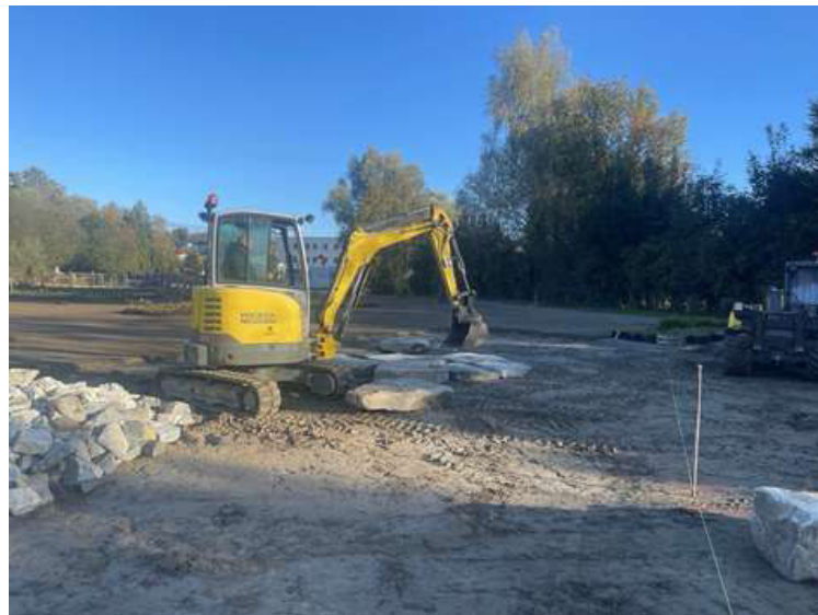
ABBILDUNG 3: DIE ERSTEN TRITTSSTEINE WURDEN VERLEGT