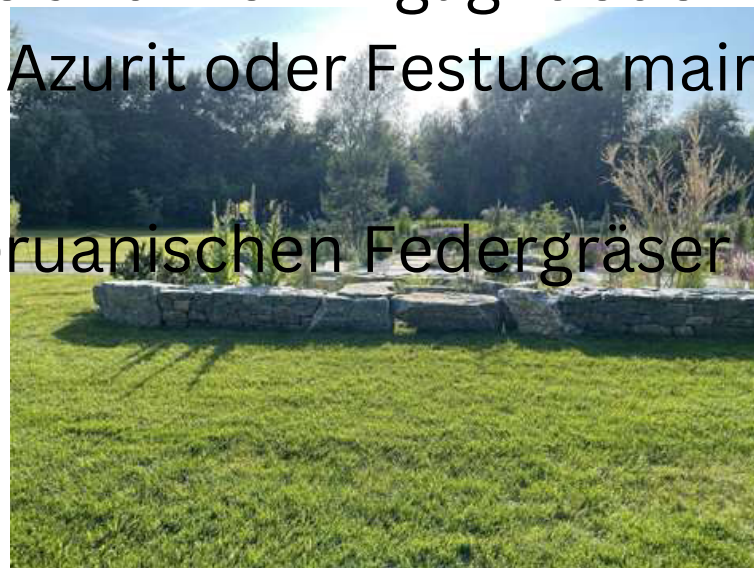
ABBILDUNG 16: TROCKENGARTEN IM SPÄTSOMMER

Den blühenden und in den verschiedensten Tönen leuchtenden Abschluss im Herbst bildeten die Gräser wie das Chinaschilf, Miscanthus sinensis Kleine Silberspinne und Morninglight oder Festuca-Sorten wie cineria Azurit oder Festuca mairei und ebenfalls die sich im Wind wiegenden Peruanischen Federgräser Stipa ichu.