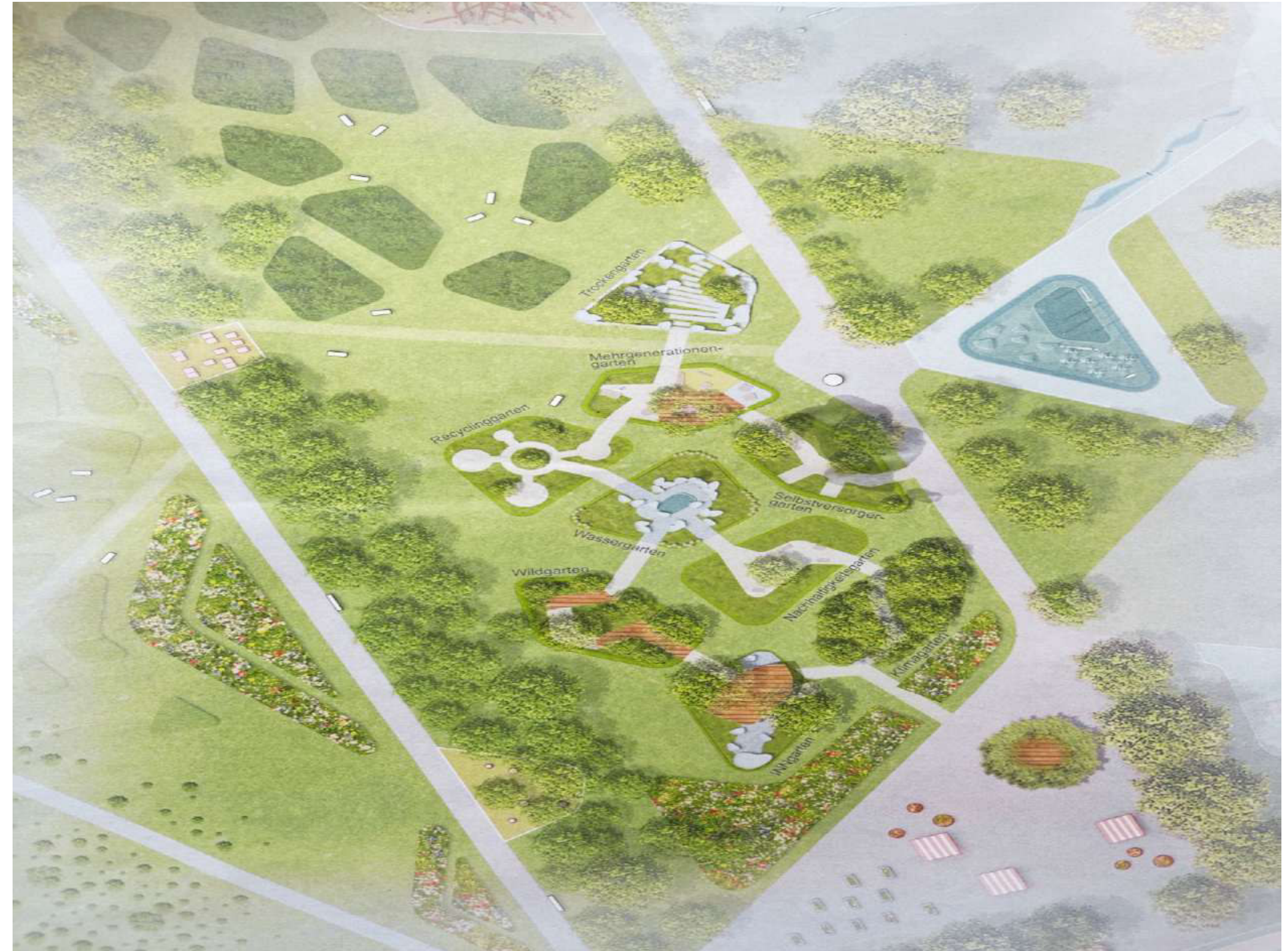
ABBILDUNG 1: PLAN SITUIERUNG DER THEMENGÄRTEN

Nach der Zusage für meine Planung begannen gleich im Herbst 2024 die ersten Aushubarbeiten und die von mir ausgesuchten und gekennzeichneten Steinblöcke aus einem Steinbruch in der Wachau wurden in das vorgesehene und zuvor abgesteckte Areal geliefert und nach Plan mit Hilfe eines Baggers versetzt.