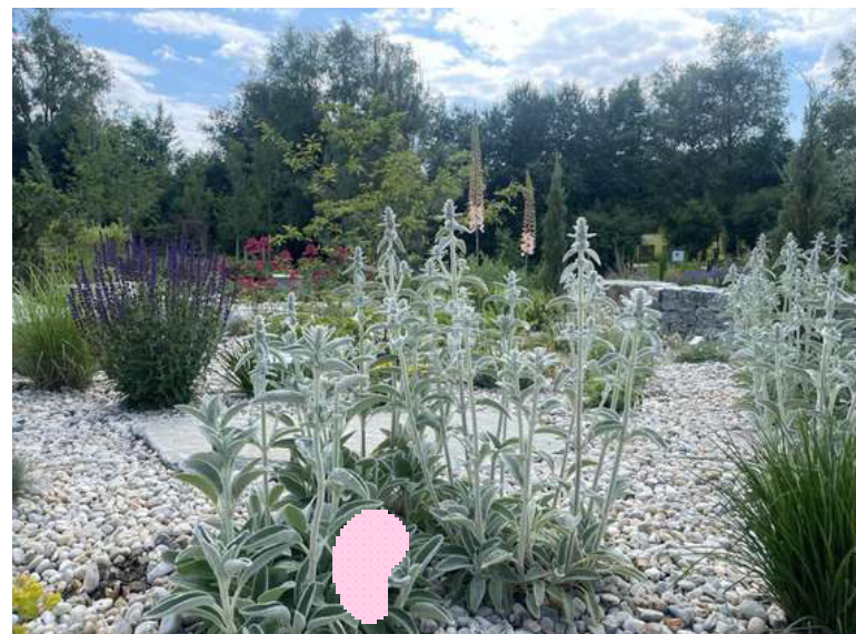
ABBILDUNG 12: STACHYS BYZANTHINA, CENTRANTHUS RUBER, SALVIA NEMOROSA