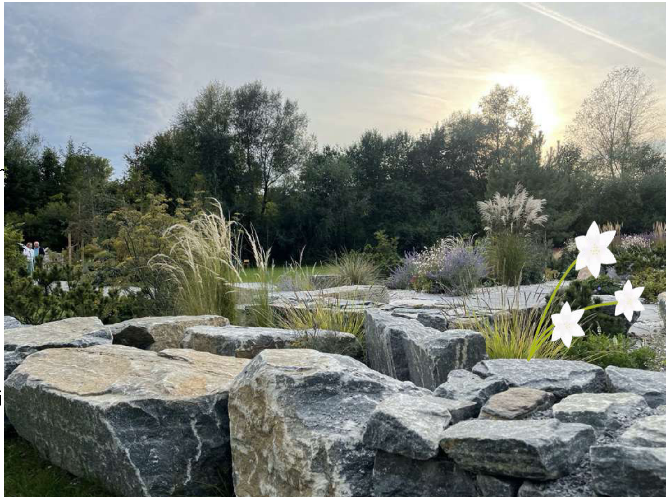
ABBILDUNG 17: BLÜHENDER HERBST IM TROCKENGARTEN