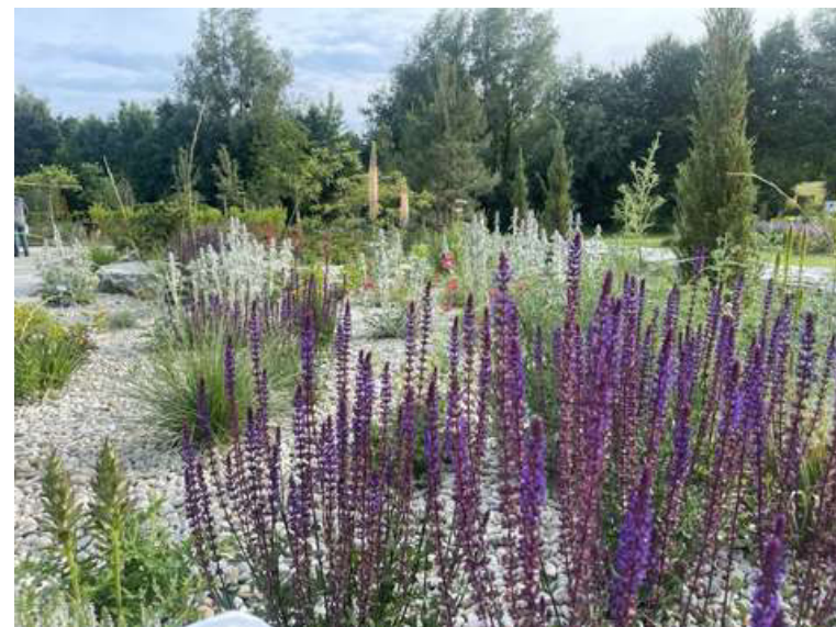
ABBILDUNG 13: SALVIA NEMOROSA, EREMURUS RUITERS MISCHUNG