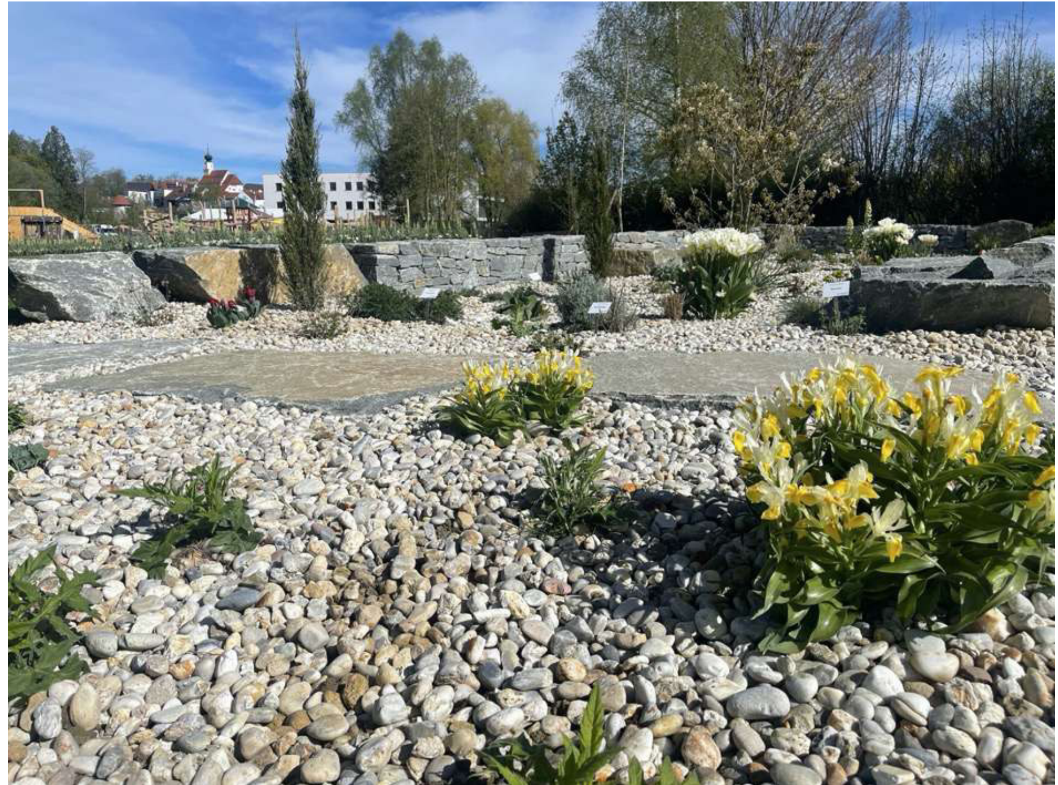
ABBILDUNG 9: IRIS BUCHARICA, TULIPA WHITE VALLEY

Bereits im zeitigen Frühjahr 2025 blühten die ersten Iris bucharica , verschiedene Tulpensorten wie Tulipa praestens Zwanenburg, Tulipa clusiana oder Tulipa White Valley .