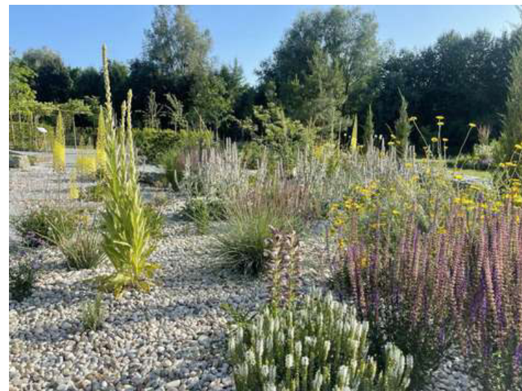
ABBILDUNG 11: SALVIA NEMOROSA, VERBASCUM OLYMPICUM, ANTHEMIS TINCTORIA