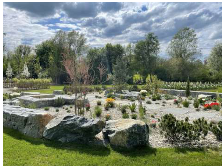
ABBILDUNG 10: TROCKENGARTEN IM FRÜHJAHR 2025