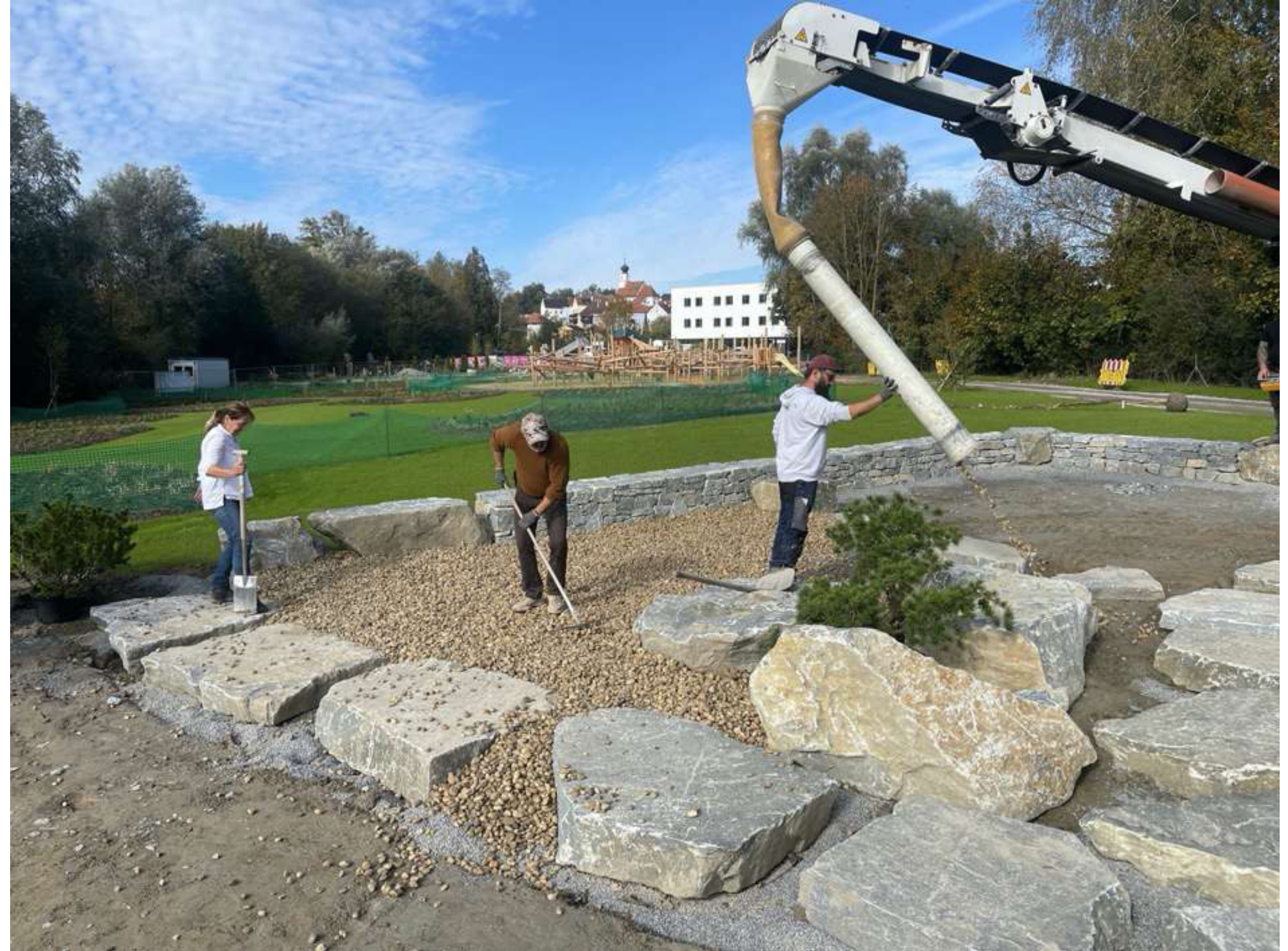
ABBILDUNG 5: ES FOLGTE DIE KIESSCHÜTTUNG