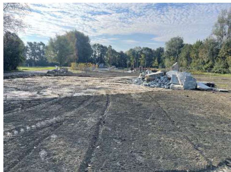
ABBILDUNG 2: ANLIEFERUNG DER GEKENNZEICHNETEN STEINBLÖCKE