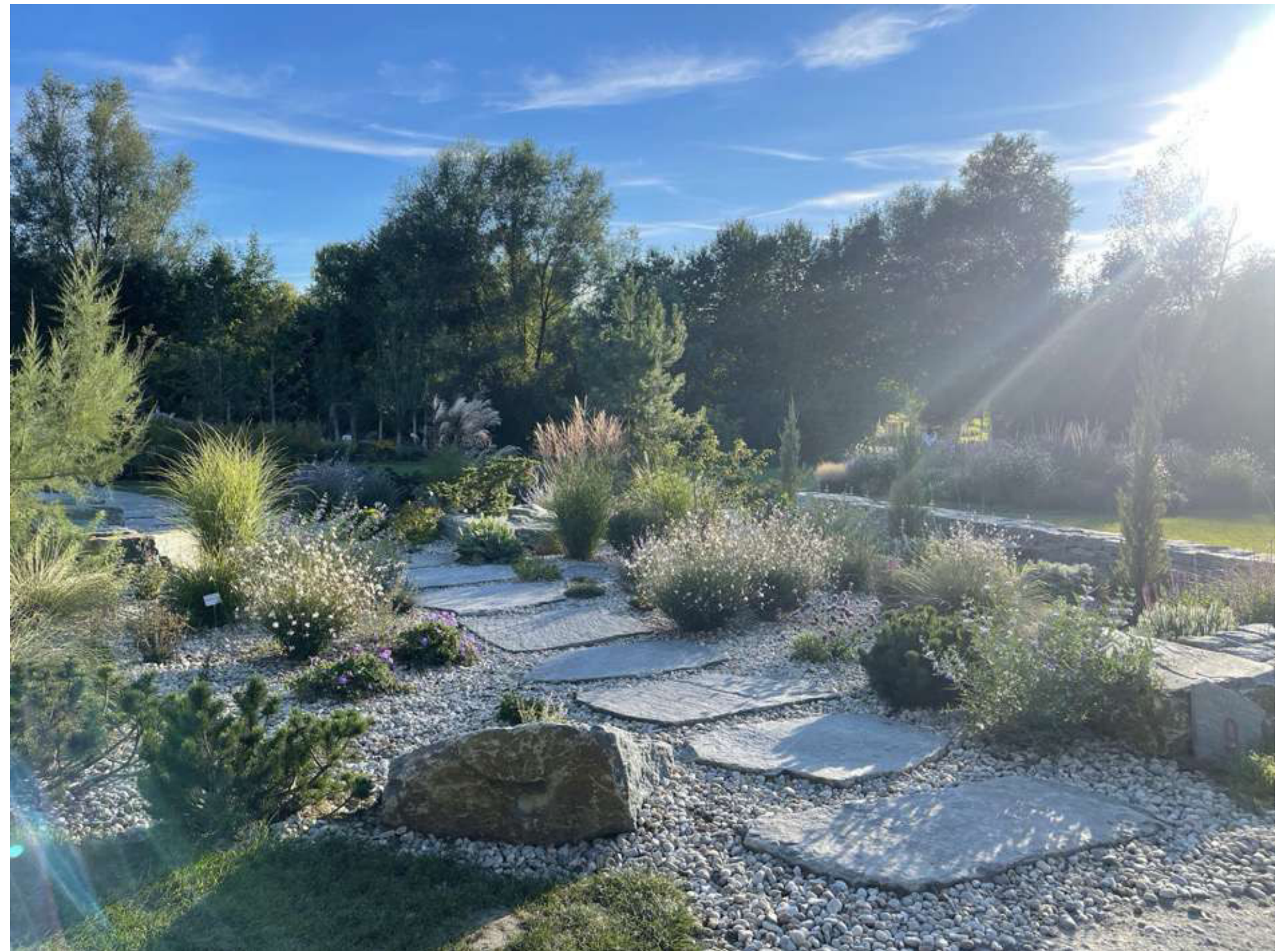
ABBILDUNG 18: ENDE DER GARTENSCHAU OKTOBER 2025