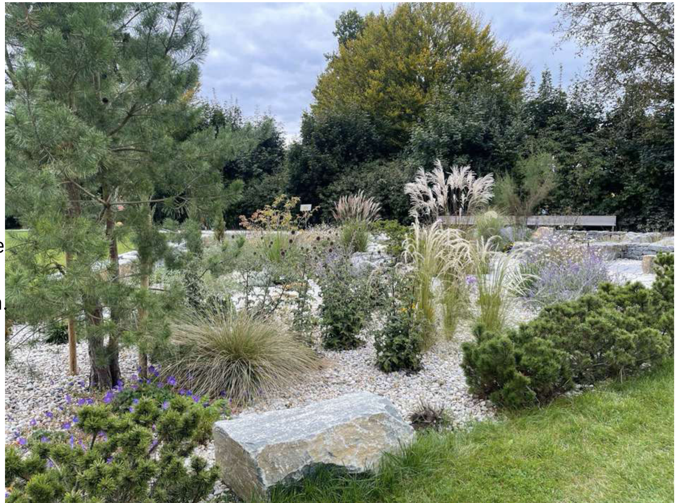
ABBILDUNG 15: MISCANTHUS SINENSIS KLEINE SILBERSPINNE, STIPA