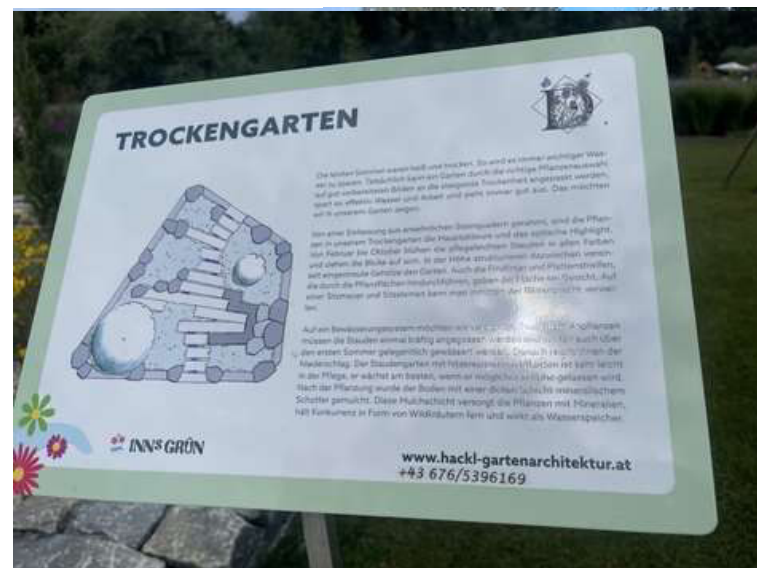
ABBILDUNG 8: BESCHRIFTUNG DES GARTENS