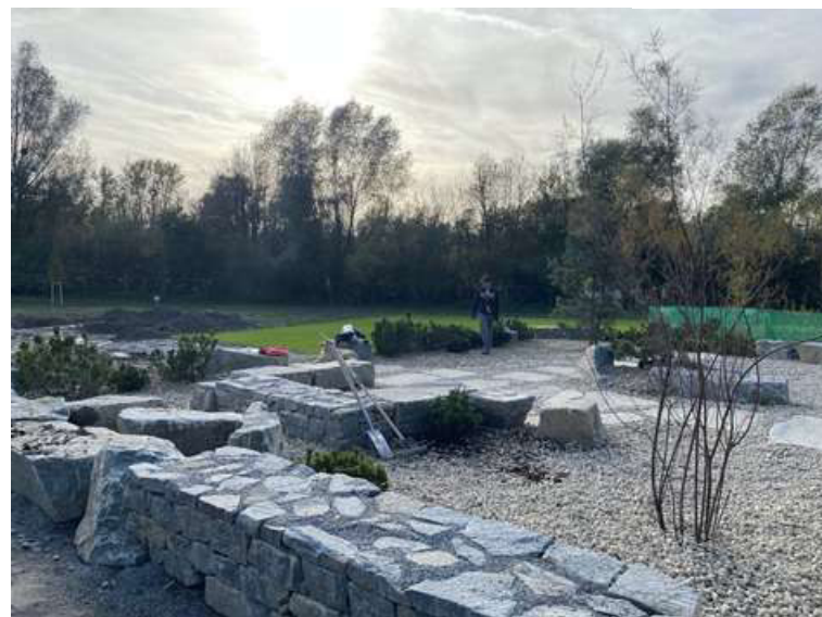
ABBILDUNG 6: EIN SITZPLATZ ENTSTAND