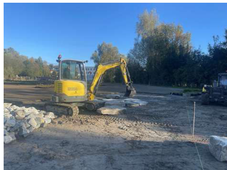
ABBILDUNG 3: DIE ERSTEN TRITTSTEINE WURDEN VERLEGT