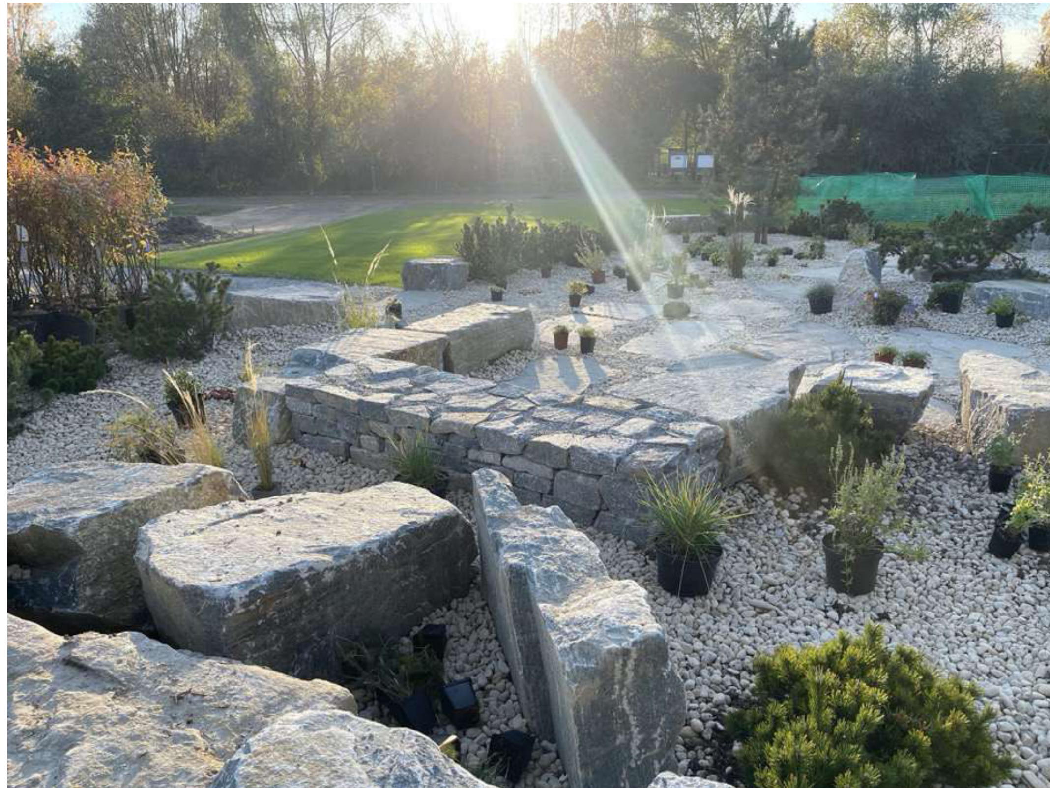
ABBILDUNG 7: GEHÖLZE UND STAUDEN WURDEN GESETZT